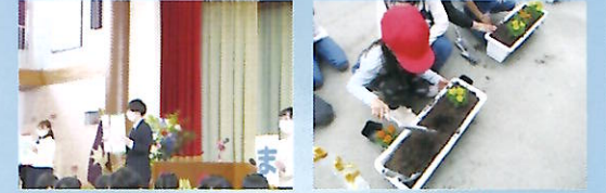
はじめての経験を大切に (入学式)