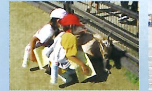
いのちを大切に (動物とのふれあい)