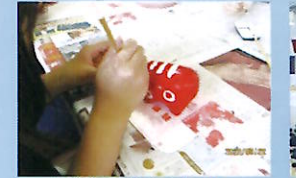
校外での体験を大切に (修学旅行)