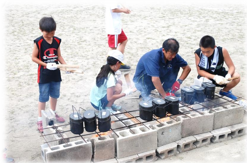
おやじの会主催キャンプ 飯盒でご飯を炊いています

楽しかった夏休みも昨日で終わりました。今年は猛暑の日が続き、プール開放が暑さのために中止になったり、台風の影響でおやじの会主催のキャンプが急きょ日帰りになったりと、天候に大きく左右されることが多かった夏休みでした。そんな天気の中でも、子供たちは家庭や地域の行事の中で、たくさんの思い出をつくることのできたのではないのでしょうか。