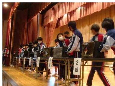
【ブラックボックス】

12月17日(金)の5,6校時を使って、今年初めてとなる学年レクリエーション大会を行いました。学年協議委員が主体となり、1学年全員が楽しめる企画にしようと呼びかけました。競技種目は、箱の中に入っているものを当てる「ブラックボックス」、マジックを制限時間内で何本積み立てられるかを競う「マジック積み」、全員で長町中に関するクイズに答える「〇×クイズ」、スプーンでピンポン玉を運び、クラス全員でつなげる「玉運びレース」を行いました。それぞれのクラスや1学年全員の絆がより深まった一日でした。競技の結果はお子様にお聞きいただければと思います。