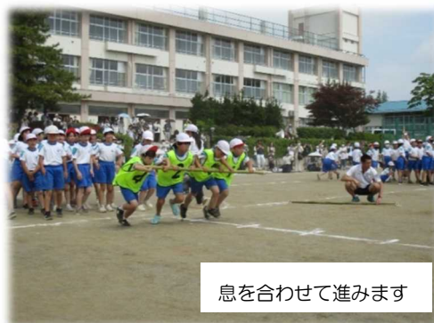
息を合わせて進みます