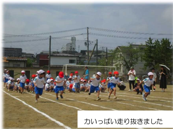
力いっぱい走り抜きました