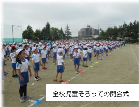
全校児童そろっての開会式