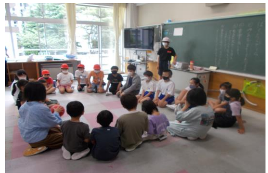
(みんなで輪になって楽しみました。)

たてわり活動が本格的にスタートしました。本校では自己肯定感や自己有用感を育むことを目的として異学年交流を積極的に進めています。6年生のリーダーは全員が楽しめる活動を事前に考え、1年生にも分かりやすく活動の内容やルールを説明するなど、自分の役割をしっかり果たしていました。人との関わりの中でしか学ぶことができないことをたてわりの活動を通して一人一人が感じ取り、心豊かな子供に成長してほしいと思います。