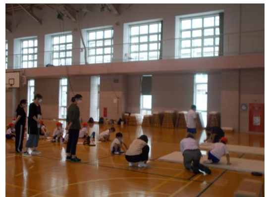
(立ち幅跳びの計測中です。)

昨年度、新型コロナウイルスの影響で実施できなかった体力・運動能力調査を行いました。全ての種目を行うことはできませんが、対策を講じた上で実施可能な種目を各学年で実施しました。1, 2年生では、学校支援地域本部を通じて集まってくださった保護者ボランティアの皆様が計測や活動の補助をしてくださりました。たくさんの方々にお手伝いいただき、スムーズに進めることができました。ありがとうございました。なお、7月は七夕飾りを作るボランティアを募集していますので奮ってご応募ください。詳しくは学校支援地域本部からのお便りをご覧ください。