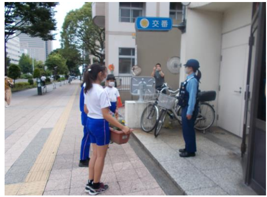
(運営委員の4名が花を届けました。)

6月25日(金)に運営委員会の4名の児童が学校を代表して、日頃お世話になっている東二番丁交番の皆様へプランターで育てている花を届けました。署長さんが対応してくださり、大切に育てますとおっしゃってくださいました。その際に3年生の児童が作成したメッセージカードも添えて渡しました。コロナ禍で人と関わりことが少なくなっている中、地域で私たちの安全をいつも近くで見守ってくださっている交番の皆様へ感謝の気持ちで少しでも伝わればよいと思います。