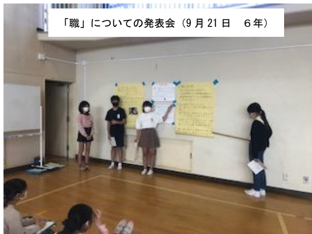
「職」についての発表会（9月21日 6年）

4年生は、泉図書館から2名の先生をお招きして音楽室でブックトークを行いました。今回のブックトークのテーマは「友達」です。先生方から「友達」に関わる本の内容を詳しく紹介していただき、子供たちは本の楽しさを感じていました。