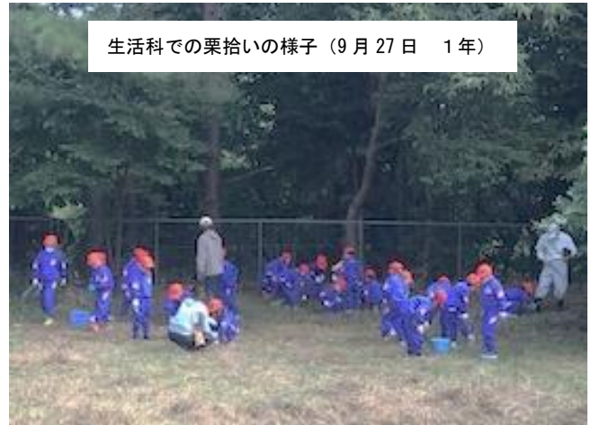
生活科での栗拾いの様子（9月27日 1年）

6年生は総合的な学習の時間で「職」について学んでいます。修学旅行の自主研修で調べたことをまとめ互いに発表し合うポスターセッションの発表会を体育館で実施しました。この発表会は授業参観で実施する予定だったものです。それぞれのグループが調べたことを模造紙にまとめ発表しました。他のグループの発表から学ぶことも多く、充実した学習になりました。