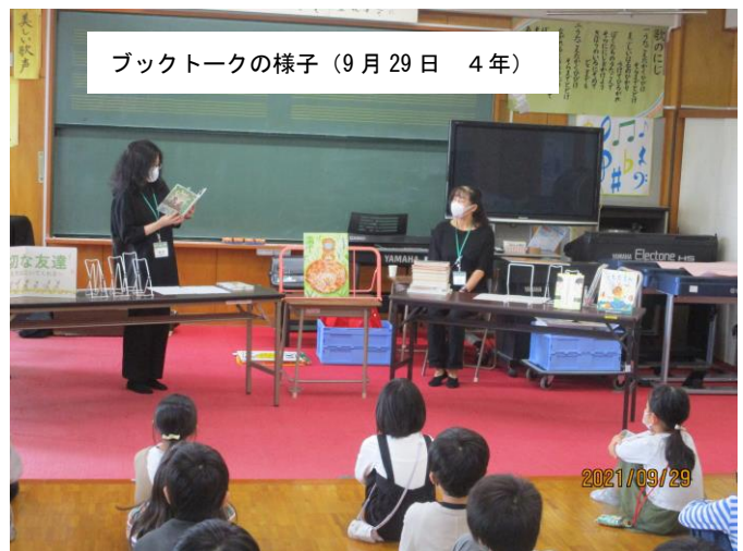
ブックトークの様子（9月29日 4年）

4年生は、泉図書館から2名の先生をお招きして音楽室でブックトークを行いました。今回のブックトークのテーマは「友達」です。先生方から「友達」に関わる本の内容を詳しく紹介していただき、子供たちは本の楽しさを感じていました。