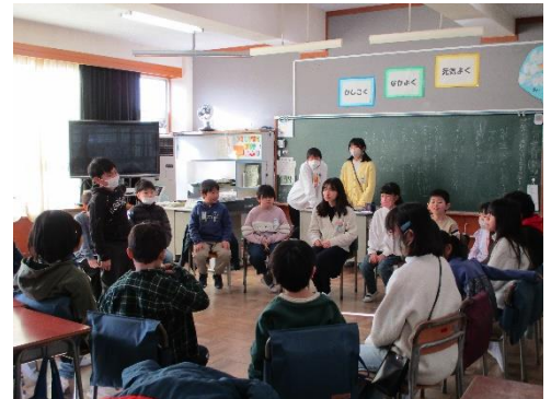
なかよし活動 6年生が活動を支援してきました。

冬休み明けの1月9日(火)、子供たちの元気な声が学校に戻ってきました。虹の丘小学校2024年のスタートです。TV放送で朝会が行われ、学校給食標語の賞状伝達と校長先生のお話がありました。お話の中に『あいさつは人と人をつなぐリボン』とありました。あいさつは、自分の気持ちや考えを相手に伝えるコミュニケーションの手段です。あいさつをすることで、相手に敬意や感謝を示したり、関係を深めたり、信頼を築いたりすることができます。今年も明るいあいさつが響き合う虹の丘小学校になるよう御家庭での御協力もどうぞよろしくお願いいたします。