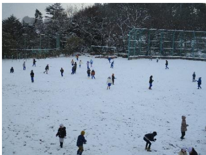
今年初の雪で大はしゃぎぎの子供たち