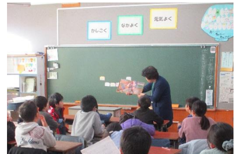
月曜日の朝は、ボランティアさんによる読み聞かせ。いつもありがとうございます。

今年の冬は暖かく、雪がなかなか降らなかったのですが、16日には今シーズン初の積雪があり、校庭一面、真っ白な雪に覆われました。休み時間には子供たちは大はしゃぎで、校庭に駆け出していき、雪玉を投げたり、そりで遊んだりと思い思いに今年初の雪を楽しんでいました。寒さに負けない元気な虹っ子です。