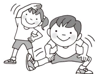
準備運動は念入りに