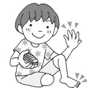
手足のつめを切ろう