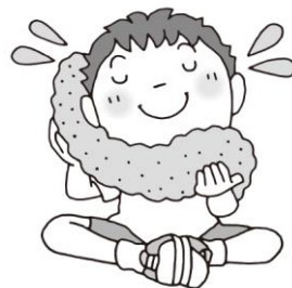
水筒とタオルを用意しよう