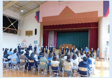
対面で行われた教職員紹介

4月21日に今年度最初の授業参観が行われました。たくさんの保護者のみなさんに、新しい学年での授業の様子を御参観いただきました。校長・PTA会長挨拶は、4年ぶりに体育館にて対面式で行うことができました。教職員紹介やPTA本部役員紹介ができたのも久しぶりのことです。学年懇談にも多くの方に御参加いただき、感謝申し上げます。その後に行われたPTA引継会、150周年記念式典実行委員会にも多数御参加いただき、ありがとうございました。今後ともどうぞよろしくお願ひします。