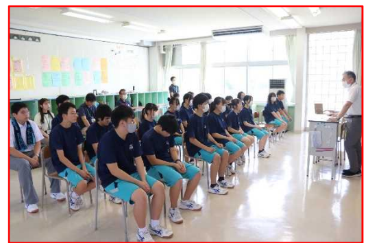
(全校集会のようす)

8月21日(月)に、夏休み明けの全校集会を行いました。校長が生徒の皆さんに向けて、次のような話をしました。 ○久しぶりの登校でしたが、「温かいあいさつ」ができました。あいさつをするときにちょっとでも微笑んでみてください。自分も相手もほっこりするし、地域全体が温かくなります。 ○「比べないことで自分に勝つ」、「いちばんの時間の無駄は、自分と誰かを比べること」。周りに左右されることなく、自分らしく自信を持って生活してほしい。 「助けて」が言えること、「助けを求めることは諦めるのとは違う」こと。何か相談したいことがあったら、ぜひ先生方に話してくださいね。