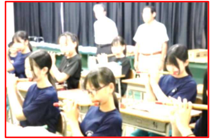
（夏休みに笛の練習をする1・2年生）

オープニングは、神楽「神子之舞」です。1・2年生23人が挑戦します。少年の主張では、8月28日に八木山中で行われる「太白区少年の主張大会」で発表する主張を述べます。英語暗唱では、8月31日に開催される英語暗唱弁論大会（青葉区・太白区）で発表する「THE Spider's Thread」を披露します。吹奏楽部は、少ない部員ですが、一生懸命練習した「A Whole New World」を披露します。