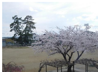
真っ直ぐ高くそびえる三本松

「豊かな心と確かな力を持ち、しなやかでたくましい子供の育成」を学校教育目標として、「笑顔輝く岡田小」、「すべては子供たちのため」をモットーとして、子供たちの健やかな成長を育むため、教職員一同頑張っています。今年度も引き続き御支援と御協力をどうぞよろしくお願いいたします。