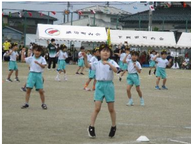
1・2年 岡田ぎつねダンス

時折小雨がぱらつく天気ではありましたが、短距離走、表現、リレーなど、児童はこれまでの練習の成果を存分に発揮して躍動しました。友達を励ましたり、下級生をリードしたり、係の役割を果たして運動会を支えたりと、子供たち同士の絆を感じたすてきな運動会となりました。