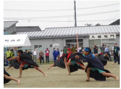
5・6年 岡田ソーラン2023！