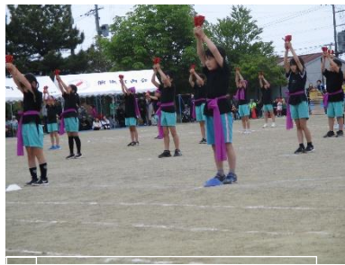
3・4年 ダイナミック琉球