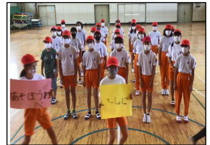
1年生への学級メッセージ