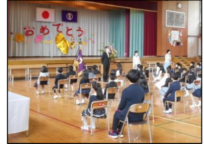
令和2年度沖野東小学校入学式

これからの活動も、内容を変更して行うことが多くなると思いますが、教育活動の意義を捉えつつ歩んでいきたいと考えております。今後も保護者の皆様の変わらぬご理解とご支援をよろしく申し上げます。