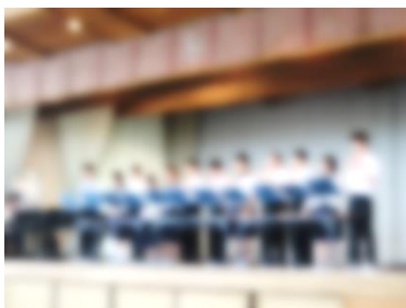
わかば学級ハンドベル

「ふれあい交流会」では, 地域の豊齢者を招待し, 地域の保育所, 小学校, 中学校, 高等学校の代表がステージ発表を行い, 豊齢者の方々との交流を深めました。中学校からは, 吹奏楽部, わかば学級, 有志団体が出演し, 司会進行を生徒会執行部が務め, 3年生全員で観客として発表を盛り上げました。豊齢者の皆さんから, 笑顔と感謝のお言葉を頂きました。会場が温かな雰囲気でもまれ, 地域が一体となる素晴らしい時間を共有することができました。