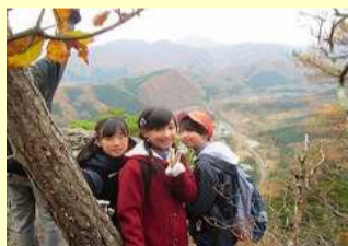
自然体験活動 鎌倉山登山