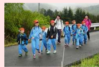
みんなdeオリエンテーリング