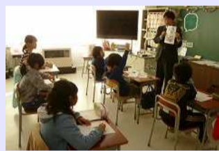
複式学級のおよさを生かした指導