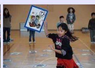
「回文の里」 ビッグ回文かるた大会