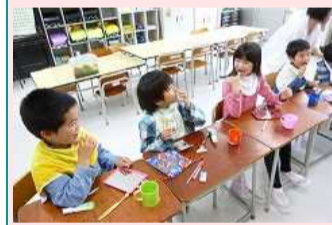
全校歯みがき指導