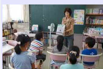
読み聞かせ ボランティアの活動