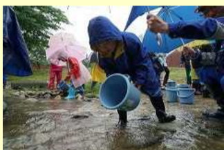
新川川でヤマメの放流