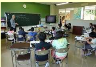
近隣校との 合同授業