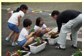
心を育てる栽培活動