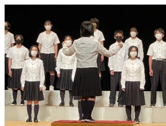
3組（上）と4組（下）の合唱