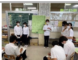
野活自研修ポスターセッション

皆さん、野外活動が終わって一カ月半が経ちますが、そこで学んだことを生かしているでしょうか。これからも野外活動で学んだことを生かしていきたいです。