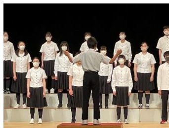
2組（上）と1組（下）の合唱