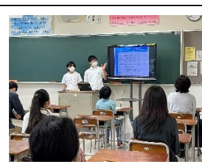
小6対象の学校説明会