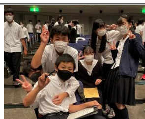
対戦が終わればノースト