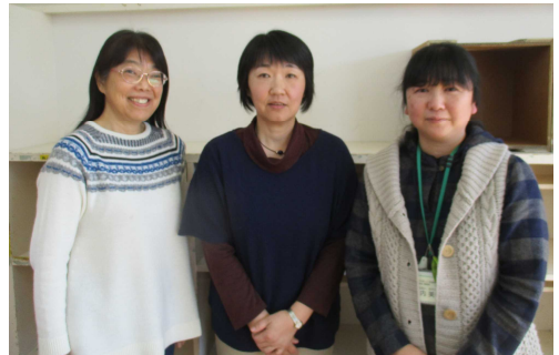
【将監小スーパーバイザー】

★スーパーバイザー 『スマイルしょうげん』★ 学校からの協力依頼を受け、活動に応じて登録いただいているボランティアさんに連絡します。