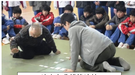
迫力ある模範演技

かるた協会の方によると、お気に入りの札を見つけて、その歌の意味を知ること百人一首の楽しみ方のひとつのことです。