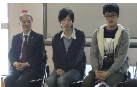
宮城県かるた協会のみなさん 現役東北大生もおふたりいました