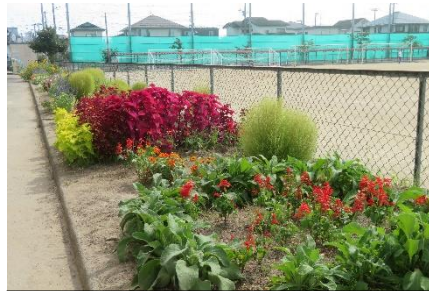
美しく成長した花壇の花々

また、休日に連絡が必要な場合、専用のメールアドレス(保護者以外には口外しない)を使用することとなっております。8月22日(月)に配付しました「新型コロナウイルス感染症に係る学校の対応等について」に詳しく記載しておりますので、使用が必要な状況等改めて御確認ください。