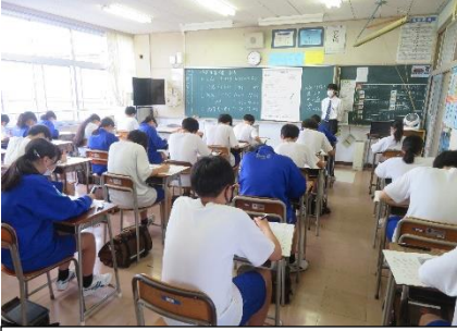
1学期期末考査に全力で挑む

日々秋を感じさせる気温となり、生徒たちは日々の授業に、各種大会に一生懸命取り組んでおります。9月5日(月)、6日(火)に行われた1学期期末考査では、これまでの学習の成果を発揮すべく、一人一人が真剣に考査に臨みました。校外では、市の駅伝競走大会では、男子が10位、女子が7位と健闘し、女子は県大会に進むこととなりました。また、仙台市中学校英語弁論・暗唱大会ではそれぞれ優良賞を受賞し、仙台市中学校弁論大会では優秀賞を受賞して仙台市決勝大会に臨むこととなり