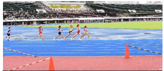
市駅伝大会に挑む選手の力走!

もうすぐ1学期の終了を迎えます。これまでの学びを振り返って成果や課題を確認し、今後どのように学習に、生活に取り組むべきかを考えられるよう指導していきたいと思っております。御家庭と一緒に子供たちのよさを伸ばしたいと考えておりますので、今後とも中学校の取組に御理解・御協力をいただきますようお願い申し上げます。