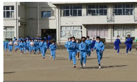
素早く落ち着いて校庭に避難

暖房機が必要となる時期に合わせて、火災対応の避難訓練を1月4日（金）に行いました。訓練日だけを知らせ、時間を知らせずに、昼休みに実施しましたが、生徒たちは落ち着いて素早く避難することができました。いざという時にも、今回の訓練のように冷静に素早く避難してほしいと思います。