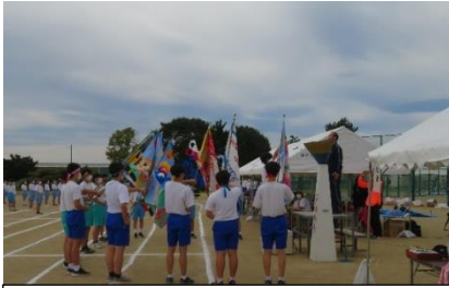
学級記に囲まれ選手宣誓

10月22日(土)に行われた運動会では、高中生は生き生きと各競技に参加し、何事にも全力投球をモットーとする高中生らしい姿を見せました。「空飛ぶ絨毯」や「長縄」では、声を掛け、励まし合いながら力を合わせて競技を行いました。中にはこれまでで一番の成績を出した学級もあり、喜ぶ姿が印象的でした。玉入れではかごに