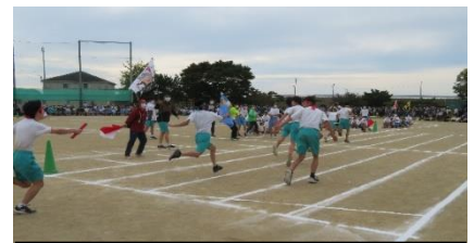
迫力ある学級対抗リレー

10月22日(土)に行われた運動会では、高中生は生き生きと各競技に参加し、何事にも全力投球をモットーとする高中生らしい姿を見せました。「空飛ぶ絨毯」や「長縄」では、声を掛け、励まし合いながら力を合わせて競技を行いました。中にはこれまでで一番の成績を出した学級もあり、喜ぶ姿が印象的でした。玉入れではかごに