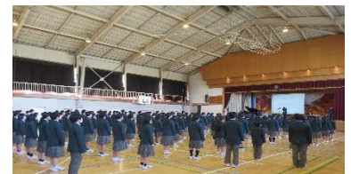
「高東桜歌」よ長野に響け

11月15日(火)は、タカトオコヒガンザクラの植樹記念日でした。それに先立ち11月9日(水)に、高砂中への桜贈呈に尽力してくれた、長野県の伊那市立東部中学校に送るためのさくらソング「高東桜歌」を全校生徒で合唱しました。高砂中が復興に向けて頑張っているときに、高砂中の枯れた桜の話を聞いて県外不出の桜を送ってくれた方々へ感謝の気持ちが届けられればと願っています。そして、復興に向けて支援していただいた方々への感謝の気持ちを忘れずに、この歌を伝えていってほしいと思います。