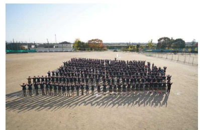
【全校生徒記念撮影】

そして11月12日(木)に東部中学校に送る全校生徒による「高東桜歌」の収録を行いました。今年は新型コロナ感染対策のため、体育館ではできませんでしたが、校庭をステージに見立て、感謝の思いをこめて全校で歌いました。マスクをつけたままでしたが、一人一人の思いが詰まっていた歌声が響きました。収録したDVDはタカトコヒガンザクラ植樹記念日に東部中学校に届くように送りました。