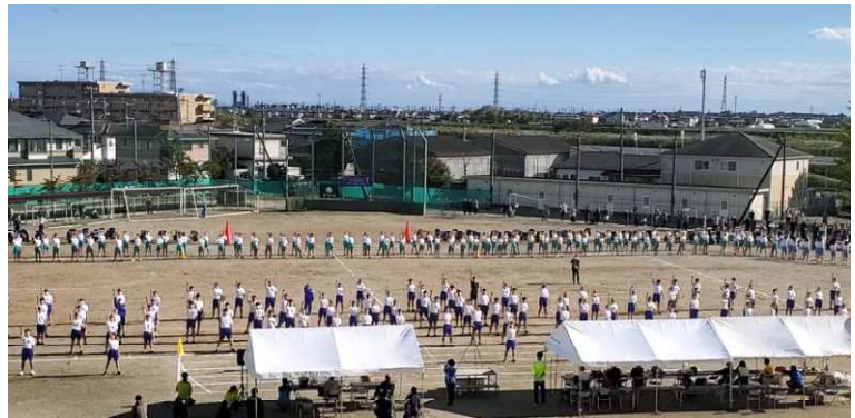
【全校生徒によるダンス演技】

10月24日(土)に、大運動会を開催しました。前日は雨天で中止が心配されましたが、当日は秋晴れの中、開催することができました。運動会実行委員会を中心に朝早くから集合し、校庭の水取りや競技の準備を行い、予定どおり競技を開催することができました。何とか運動会を成功させようとする生徒達の強い思いが感じられました。開会式が始まり、整然と並び姿や集団行動がしっかりできる姿はすばらしいと思います。いよいよ競技が始まり、各クラスともそれぞれの種目で工夫した作戦をたてながら取り組んでいました。コロナ禍の中で大きな声援を上げることができませんでしたが、大きな拍手で競技を盛り上げていました。