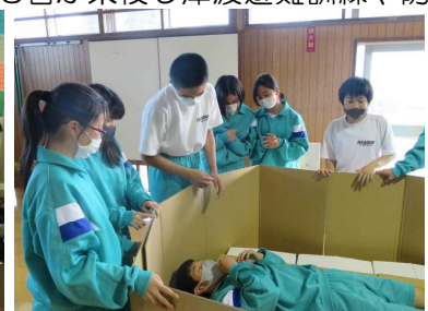
【段ボールベッドの作成】