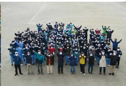
【よこしま園芸部の皆様と】