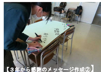
【3年から感謝のメッセージ作成②】