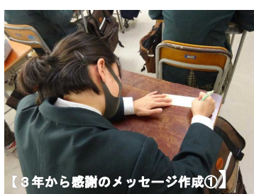
【3年から感謝のメッセージ作成①】