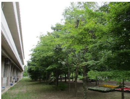
令和4年の森の様子