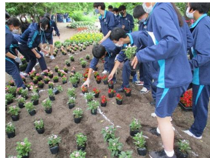
令和4年6月の花植えの様子