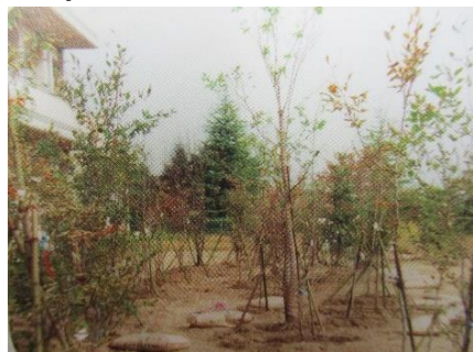
平成12年の森の様子

6月の活動では、講師の指導の下、3年生と保護者の方々が協力して伐採した枝の処理や土作り、花植え等を行いました。