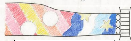
最優秀賞：「夏から秋へ」 1年生徒