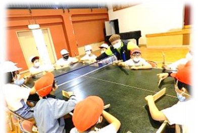
パラスポーツ体験(4年)