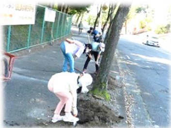
花植ネットワーク土作り