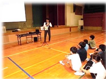
自分づくり夢教室(6年)