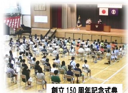
創立150周年記念式典

7月8日(土)に創立150周年記念式典を行いました。雨天のため、バルーンリリースは延期になりましたが、無事記念式典を滞りなく行うことができました。これからも希望に満ちた子供たちをさらに大きく心豊かに育てるため、教職員一丸となって努力していきたいと思えます。今後とも本校の教育にご理解とご協力をお願いいたします。