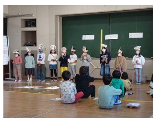
2年生 音楽 演奏の発表