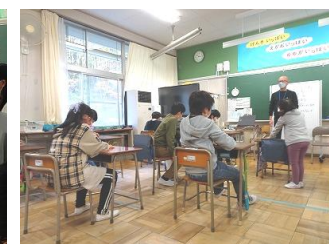
かやのみ学級 生活单元 なわとび大会をしよう