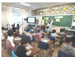
1年生 道徳 学習の振り