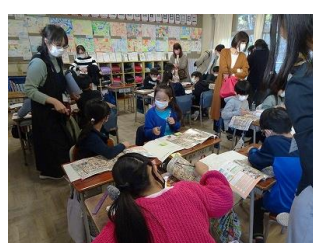
3年生 社会 調べ学習