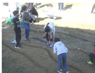
5年生 理科 実験