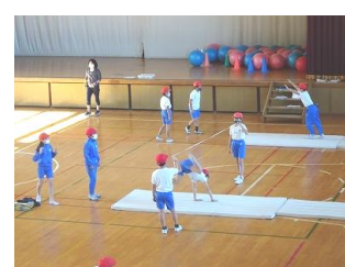
4年生 体育 マット運動