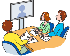
※「コミュニティ・スクール」とは保護者や地域住民等と学校で組織する「学校運営協議会」を設置した学校を指します。