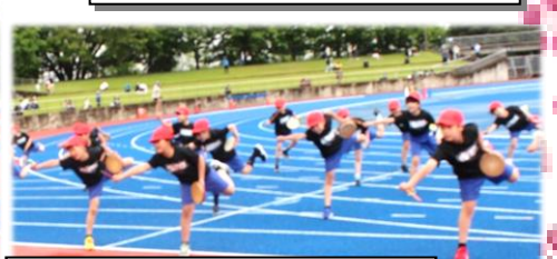
【4年】ひびけ！ 榴小エイサー2021