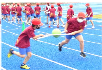
【5年】BHR (ボール運びリレー)