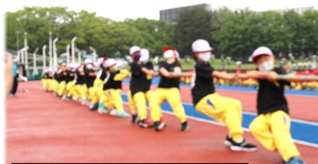
【3年】鬼滅の刃 ～無限綱引き編～