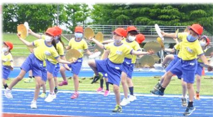
【2年】はばたけ！ 榴小すずめ2021