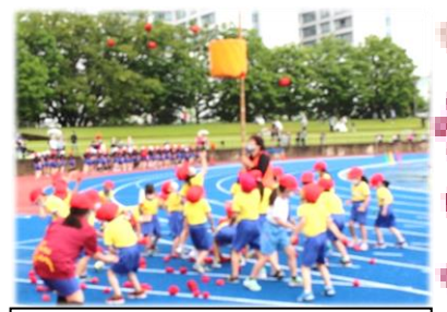
【1年】えがおいっぱい かごいっぱい