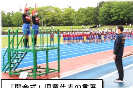
「開会式」児童代表の言葉