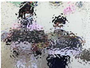
3年生は、1年生の教室を装飾してお祝いしました。その様子の紹介です。

4月27日に1年生を迎える会を開きました。例年とは異なり、対面ではなくテレビ放送によるものでしたが、お互いの温かい気持ちが伝わる会になりました。