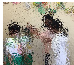
4年生からは、入学をお祝いする手作りのメダルが贈られました。