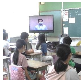
夏休み明けテレビ朝会です。

夏休みが明けると、1学期のまとめの時期になっていきます。しばらくは残暑が続くものと思われませんが、学校では感染予防に努めながら教育活動を進めてまいります。引き続きご協力の程、よろしく願いいたします。