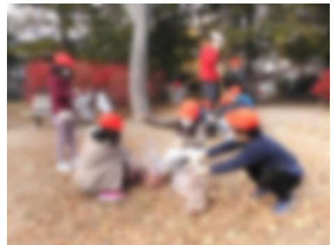
公園の落ち葉もたくさん拾いました。

当日は、多数の保護者の方々、地域の方々にもご協力をいただき、大変助かりました。ありがとうございました。