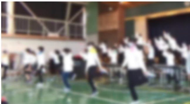
5年生「マイバラード」等