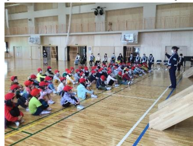
警察署、交通指導隊、PTA健全育成委員の皆さん

低学年と中学年の交通教室が行われました。低学年の子供たちは、実際に学校の周りを歩いて、信号のない歩道の安全な横断の仕方などを学びました。中学年は、体育館で動画を視聴し、警察の方のお話を聞いて正しい自転車の乗り方等について考えました。警察署、交通指導隊、PTA健全育成委員の皆さんにご協力いただきました。ありがとうございました。