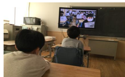
1年生を迎える会を視聴している様子

各学年で役割を分担し、全校児童が87名の1年生の入学をお祝いしました。感染対策のため、事前に収録した動画を視聴しながら、各学年から心のこもったプレゼントが放送で紹介されました。1年生からも動画で全員のすてきな笑顔をプレゼントしてもらいました。心が温かくなる会となりました。