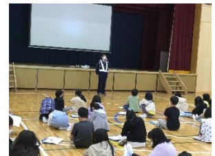
体育館で学習する中学年