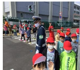
横断歩道を渡る低学年