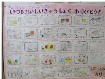
給食室のみなさんへ感謝のメッセージ