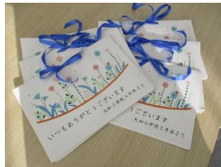
業者さんへ感謝の手紙