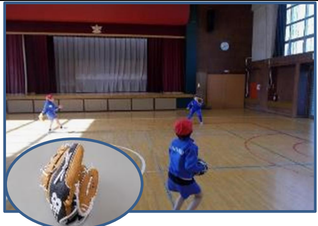
大谷選手から届けられたグローブです。休み時間などに子供たちは、学級ごと遊んでいます。