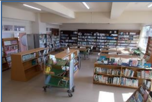
P T Aから図書室に書棚等を寄贈していただきました。1月末から改装のため閉館していましたが、先週からリニューアル開館しています。明るくなった図書室で読書に親しんでほしいと思います。